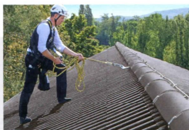
ARBEITSSICHERHEIT Hier wird abgehängt