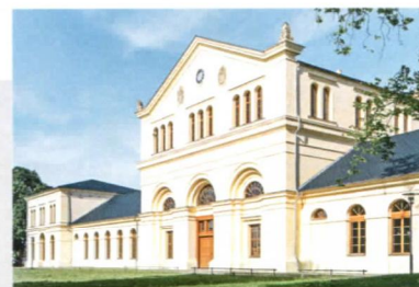
METALLDACH Hier wird abgefeiert